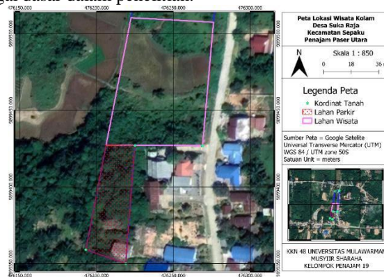
Gambar 1. Peta Lokasi Potensi Ekowisata

Sebagai langkah awal dalam penentuan pembangunan ekowisata, diperlukan pemetaan wilayah potensi ekowisata dengan menggunakan GPS sebagai alat bantu. Pemetaan ini dilakukan dengan menyusuri daerah- daerah di lokasi pembangunan secara langsung. Dari hasil survei lapangan didapatkan bahwa luas lahan yang tersedia sebesar 12.672 m 2 , dengan lahan yang dapat di dimanfaatkan untuk pembangunan ekowisata sebesar 6.468 m 2 . Data yang telah dikumpulkan akan diproses menggunakan piranti lunak QGIS dan dilanjutkan dengan proses layouting peta. Berikut ini adalah peta lokasi potensi ekowisata yang dijadikan sebagai dasar dalam penelitian.